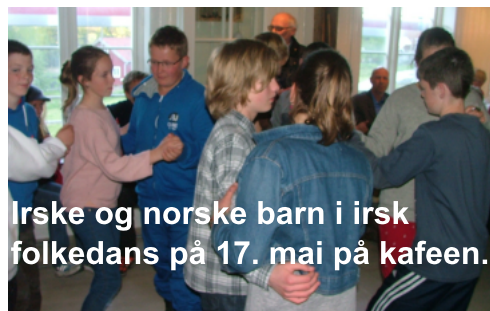
Irske og norske barn i irsk folkedans på 17. mai på kafeen.

Eksemplet med internasjonalt samarbeid ved bruk av IKT og elevutveksling ga positive utfordringer, god læring og trivsel for elever, lærere og foreldre.