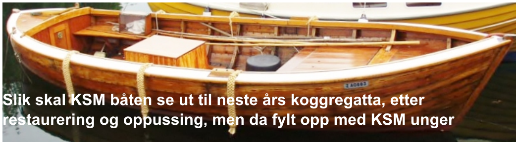
Slik skal KSM båten se ut til neste års koggregatta, etter restaurering og oppussing, men da fylt opp med KSM unger

De mangler eik- og furu-plank til nye bakker og dollbord.