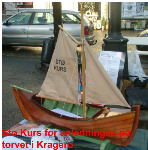
Stø Kurs for anledningen på torvet i Kragerø

Han er flink med trearbeid og har laget denne flotte Stø Kurs kogen i miniatyr for oss.