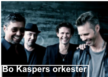
Bo Kaspers orkester

De spiller gamle rock og blueslåter fra 60- og 70 tallet og 1800 talls fra Vestfold fra 180 og Margrethe Munthe-sanger m.a.o. et variert utvalg av "svisker".