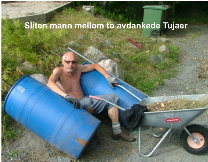
Sliten mann mellom to avdankede Tujaer

Å få med bilder med takk i Flaskeposten til alle som bidrar er en umulig oppgave. Det ville bli et volum som en Aftenpostens boligdel i lørdagsutgaven.