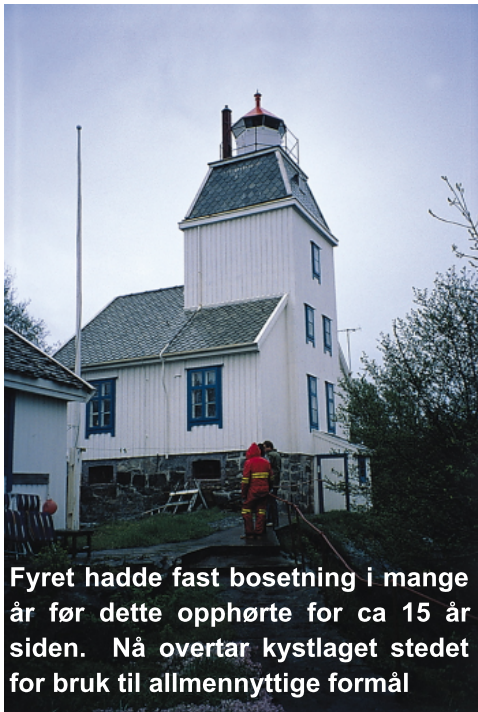
Fyret hadde fast bosetning i mange år før dette opphørte for ca 15 år siden. Nå overtar kystlaget stedet for bruk til allmenntilgjengelige formål

Disse opplysningene kom fram på Kystlagets årsmøte som ble holdt den 7. mars med 25 medlemmer til stede.