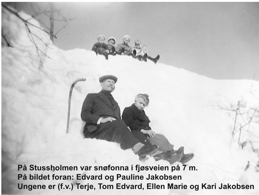
På Stussholmen var snøfonna i fjøsveien på 7 m.