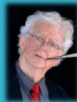
Jan Erik Vold «Poet in residence»