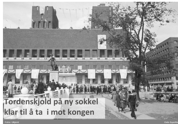
Tordenskjold på ny sokkel klar til å ta i mot kongen

Et relieff av Albertine er plassert på Rådhusets hjørne, som Rose beskriver med at: "hun ivrig speider mot fristende kjøttvarer hos slakter Bjercke". Så