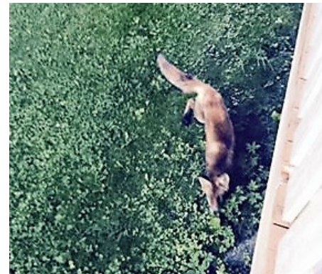
fra verandaen der Tobias bor Ryggsekkane, som består av den generasjonen som mener alt var bedre før, vet ikke hvor de skal legge turen for å unngå reven. Konspiratoriske elementer i denne gjengen vil ha det til at reven må ha lusket rundt teltene til Rød Ungdom og misforstått et eller annet politisk utsagn om dyrevelferd og menneskers godhet.

Takket være facebook sitter nå frittgående høner bak lås og slå og glor uforstående på mat-mor eller -far som ikke slipper de ut på dagen en gang.