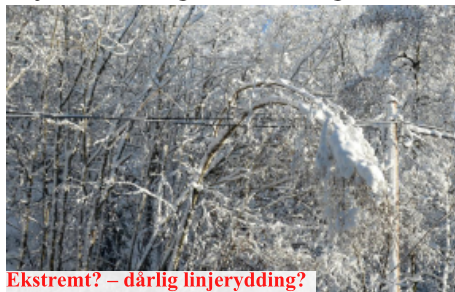
Ekstremt? – dårlig linjerydding?

Problemene dette forårsaker for linjennettet er trolig menneskeskapt, men da i form av manglende rydding av trær i linjetraseene og ikke endringer i klima.