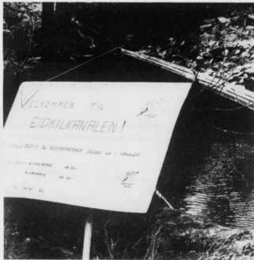
«Velkommen til Eidkilkkanalen» forteller plakaten som viser at det selges passeringsbevis og klistremerker i kanalen.