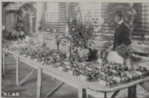
Frugtsamlingen paa Amsutstillingen i Kragerø 1909. Gartneriet blev paa denne Udstilling tilkjendt 4 Sølvmedaljer.