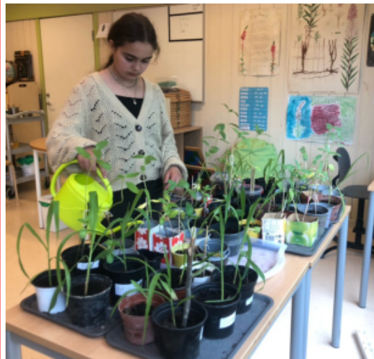
Tor D

Frø fra mais og solsikke sådd for en måned siden er nå, takket være godt stell av flittige barnehender, klar til utplanting på "Grønne Havet"