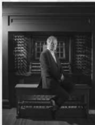
19. juli kl 11.30 Kåre Nordstoga